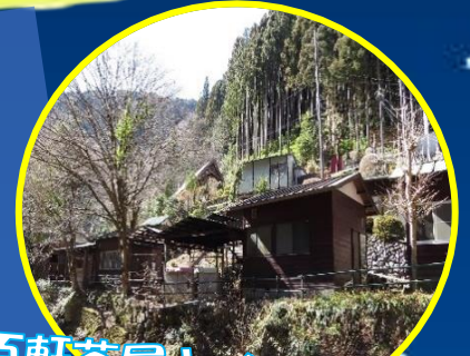
百軒茶屋キャンプ場で レッツおとまり!

はじめてとチャレンジがいっぱい! 大好きなお友達と一緒に泊りにチャレンジしよう! みんなで楽しめる自然体験活動が盛りだくさん! たくさん遊んで!たくさん食べて!たくさん寝て! みんなでお泊り名人をめざそう!