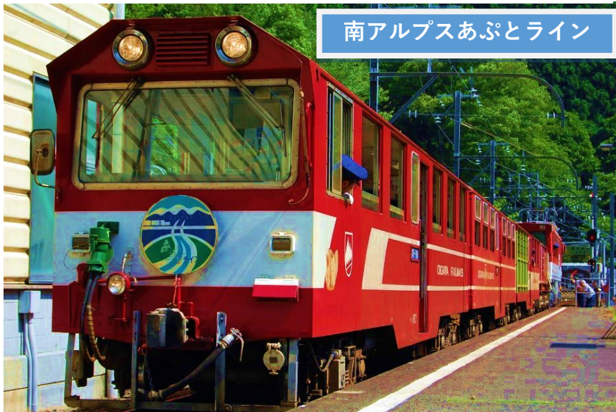
南アルプスあぶとライン