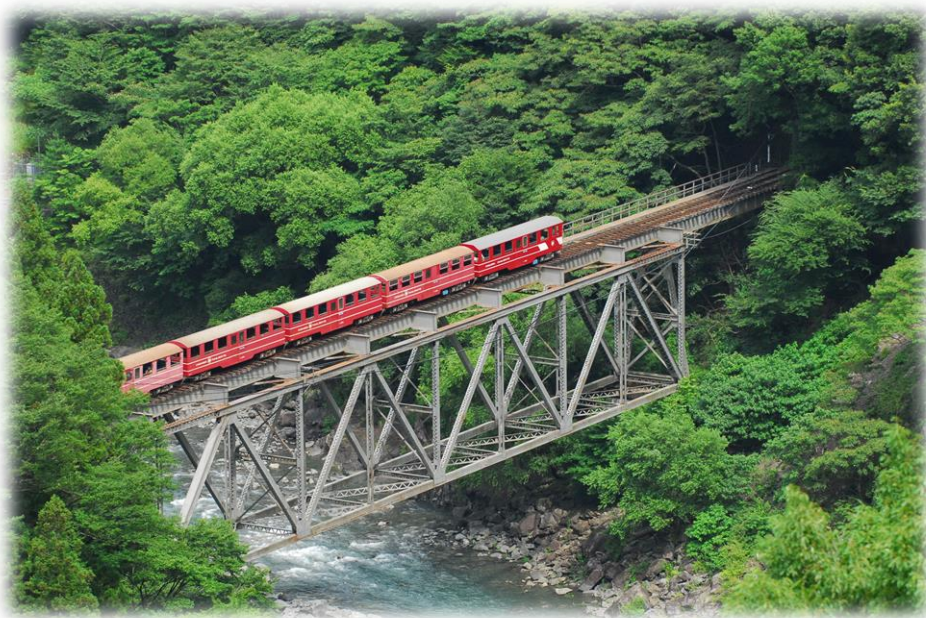
奥泉～アプトいちしろ間を運行する『南アルプスあぶとライン』

2本のレールの真ん中に歯車レール（ラックレール）を敷き、それにアプト式電気機関車の床下に設けられた歯車（ラックギア）を噛み合わせ、急勾配の線路を登り降りする鉄道。アプトいちしろ駅から長島ダムの間にある1000分の90という日本一の勾配を運行します。スピードは自転車と同じくらいの15キロでゆっくり走ります。