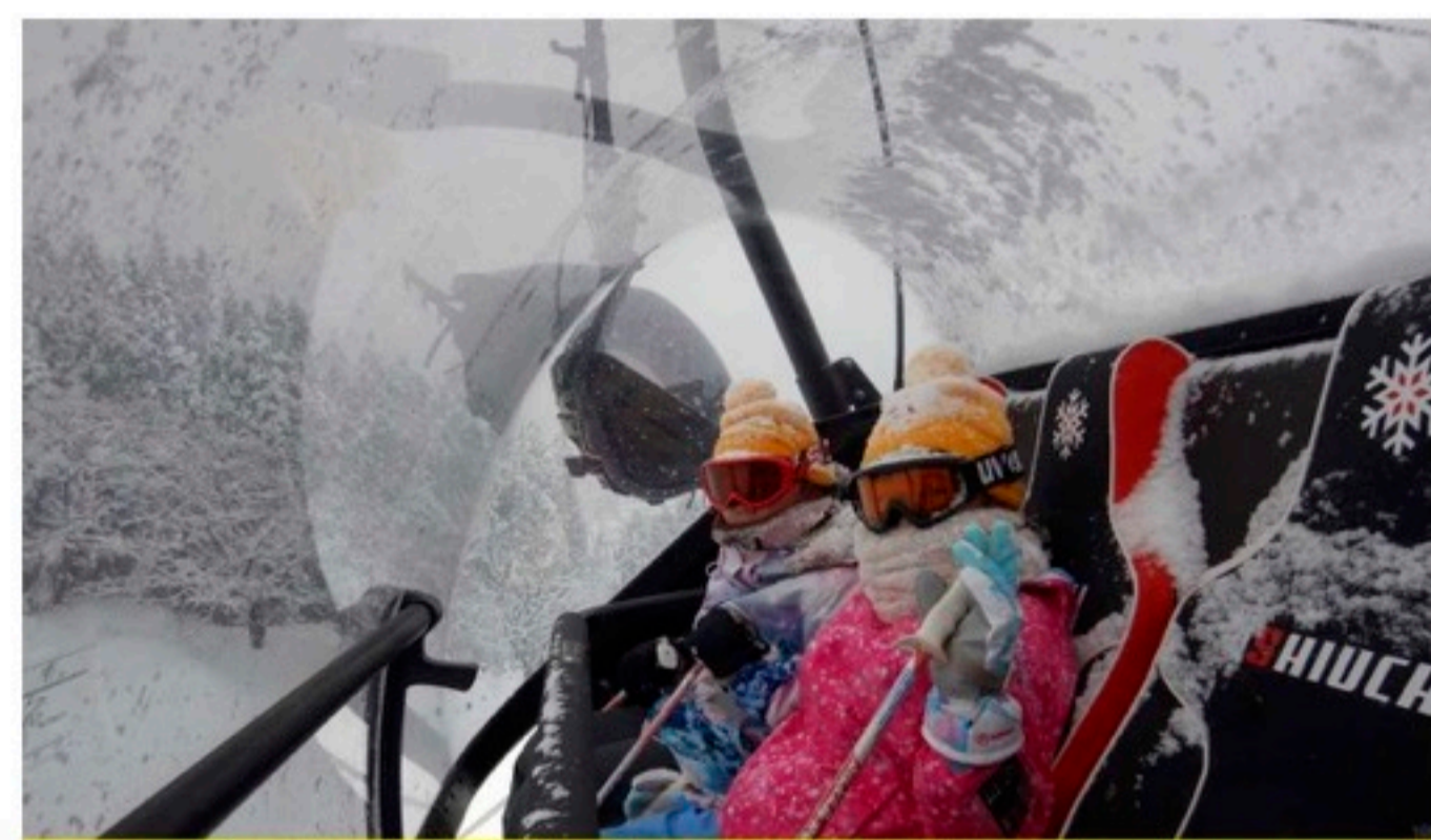
サンライズエクスプレス内豪華な6人乗りリフトです。