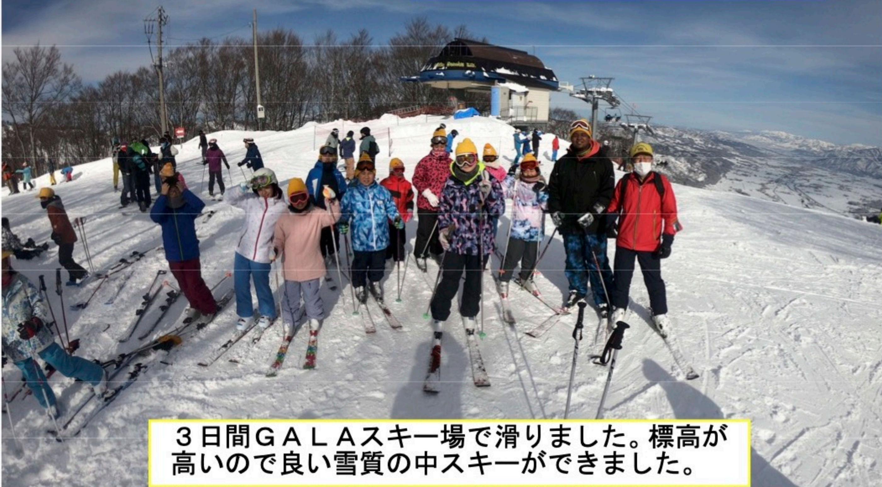
3日間GALAスキー場で滑りました。標高が高いので良い雪質の中スキーができました。