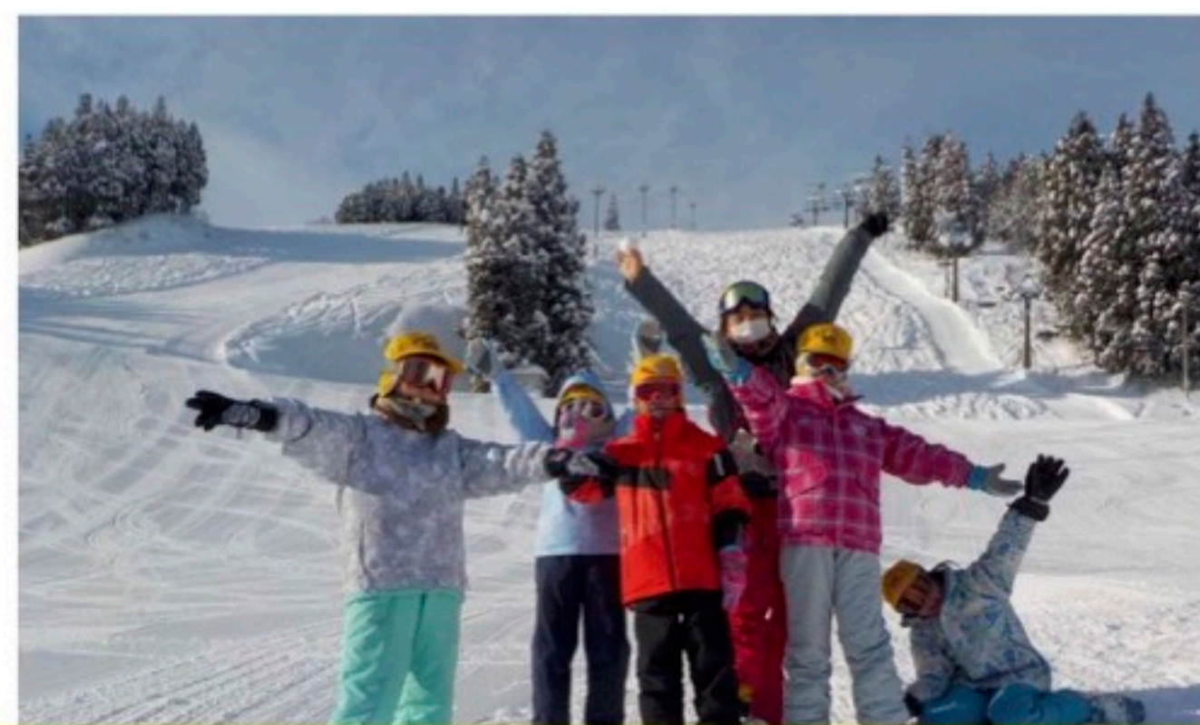
初心者も経験者と合流です。滑れるようになりました！