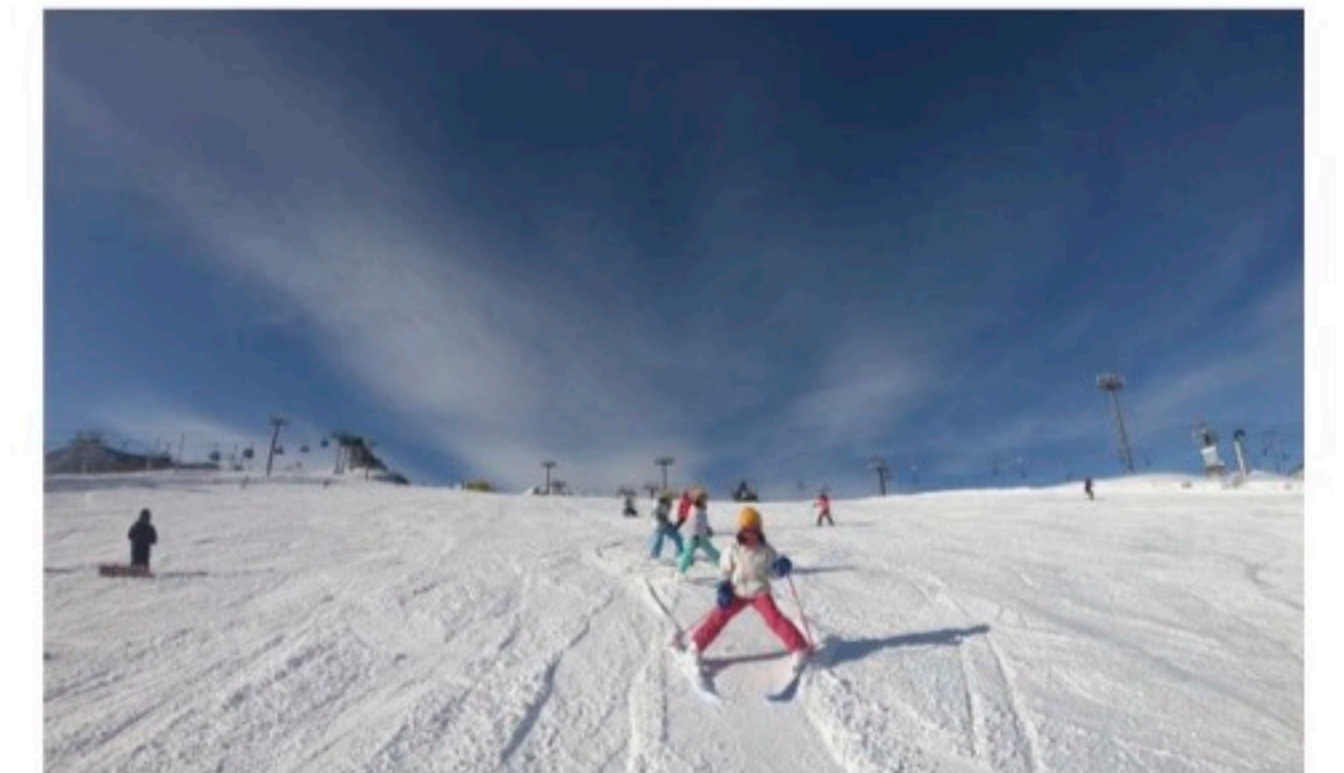
滑るスキーは風切る速さ♪スピード感最高です。