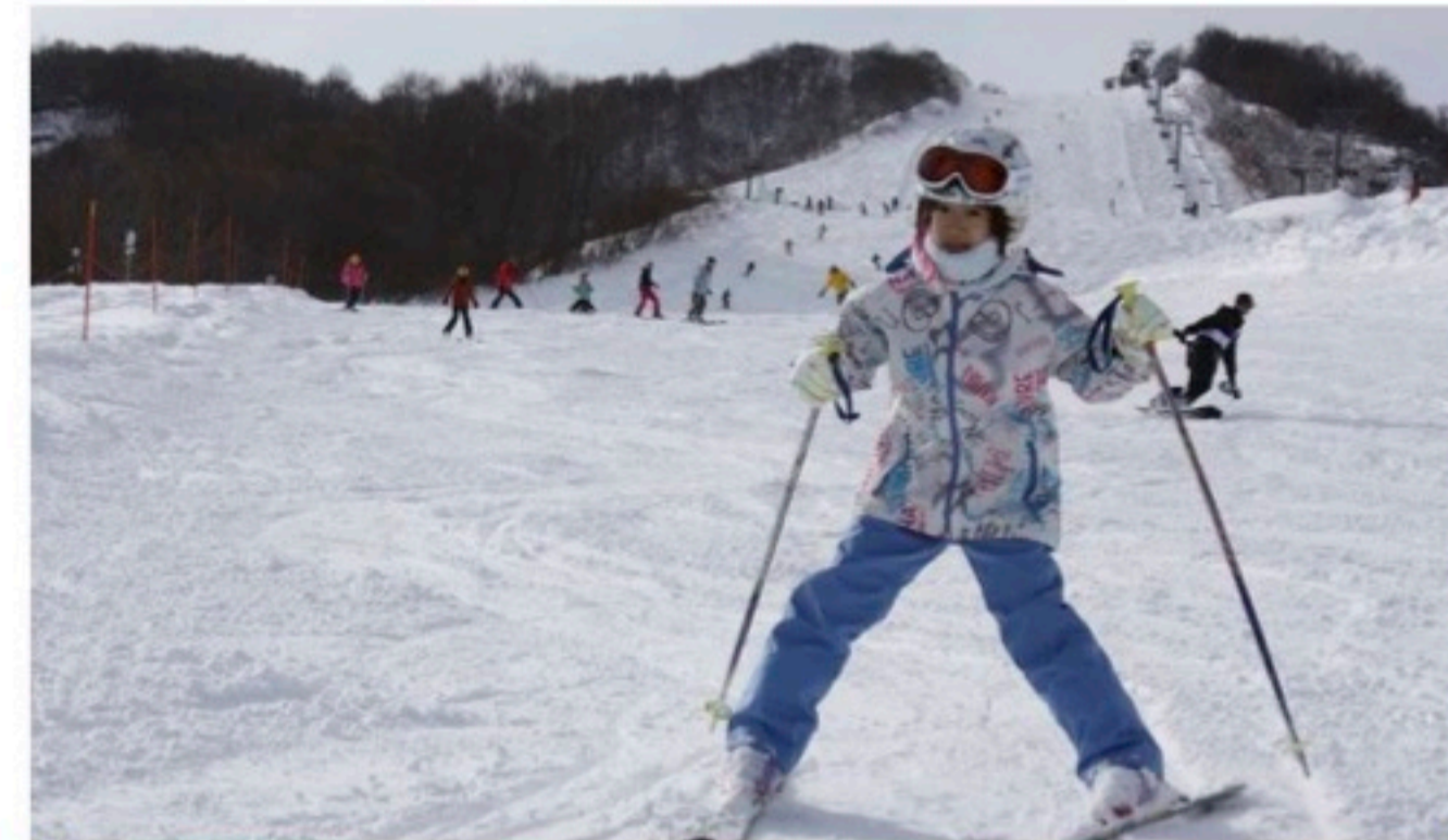
山頂から滑り降りてきました。広いゲレンデ、多彩なコース！